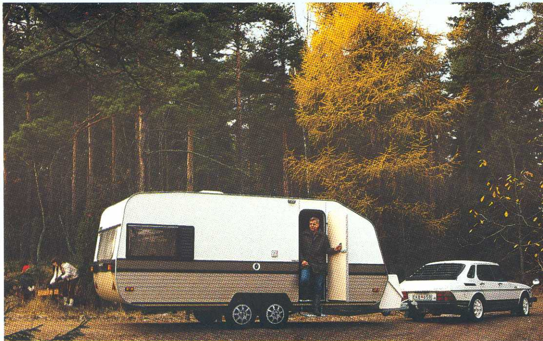
"Den maffiga tvårummaren"(Motor 23/81), "Ny toppvagn från Lohja. En utomordentligt elegant Finlandia med boggie och i brett utförande". (Motorförelären 19/81.)